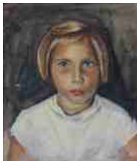
Портрет девочки 1950-55 г.