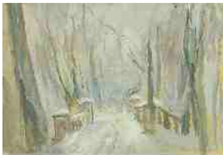
Туманное утро. Ангелов мост 1936 г.