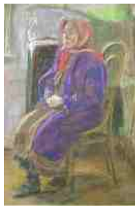
Старушка соседка сидит на стуле 1917 г.