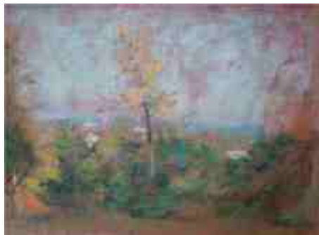
Вид Тарту с горы Тоомемяги 1960 г.

Прекрасный вид на город открывается с горы Тоомемяги, называемой по-старинному Домбергом, где изначально был основан город. На горе уходят в небо частично реставрированные руины Домского собора, растут высокие деревья разбитого в начале 19 века английского парка и украшают парк два моста, связанных своими наименованиями с историей университета.