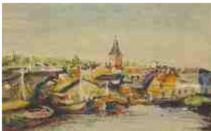
Вид Тарту с Яановой кирхой 1930 г.