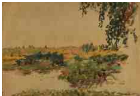
В окрестностях Челябинска 13.06.1920 г.