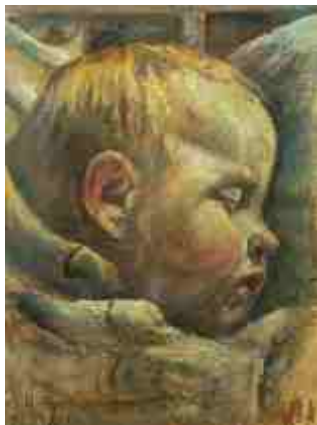
Фаия спит 1927

К сожалению ни одна экспозиция не сможет дать полного представления о его творчестве – многое разошлось, погибло во время войны, затерялось, но каждая выставка снова воскрешает память о нём и всякий, кто увидит его работы, познакомится с человеком, начавшим более ста лет тому назад своё творчество, помянет его добрым словом и его глазами посмотрит на окружающий нас мир.