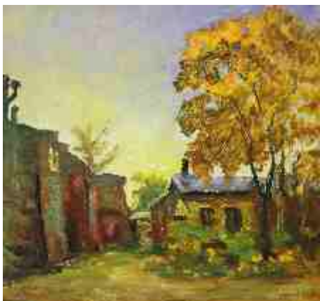
Дворик осенним утром 1966 г.

Прекрасный вид на город открывается с горы Тоомемяги, называемой по-старинному Домбергом, где изначально был основан город. На горе уходят в небо частично реставрированные руины Домского собора, растут высокие деревья разбитого в начале 19 века английского парка и украшают парк два моста, связанных своими наименованиями с историей университета.