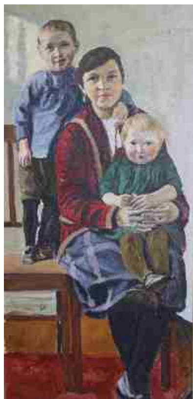
Жена с детьми 1927 г.