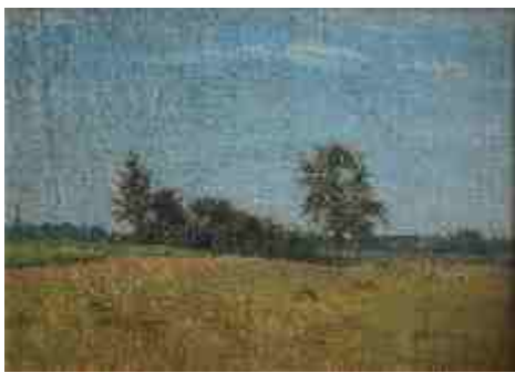
Хуторок под Юрьевом 7.07.1917 г.