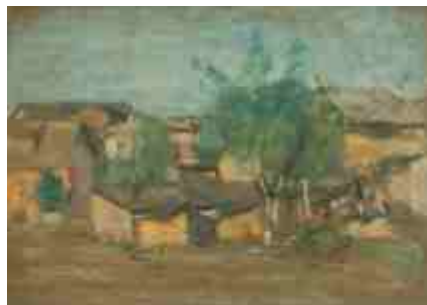
Тарту 26.06.1959 г.