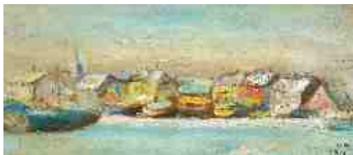
Улица Фортуна 1929 г.