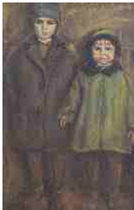
Ука и Ака 1930