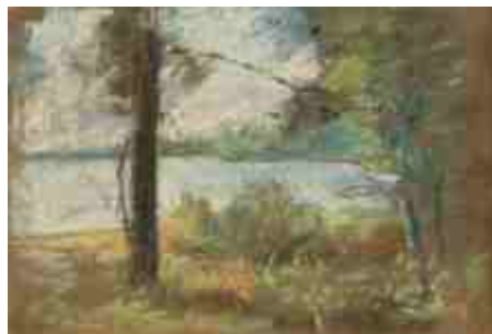
Пейзаж 12.11.1964 г.