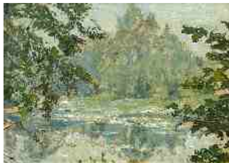
Озеро Вильянди 1942 г.