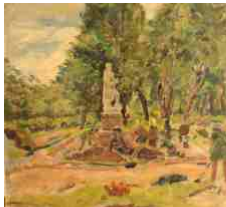
Парк Раади. Перед открытием памятника 21.07.1949