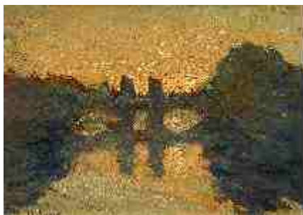
Белая ночь. Каменный мост 1912 г.