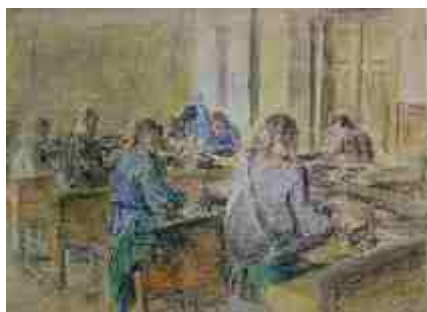
Ателье. Слепые за работой 1949 г.