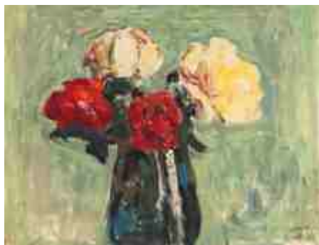
Розы 2.07.1969 г.