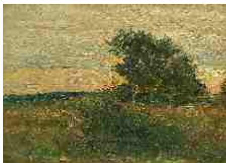
Вечереет 1912 г.