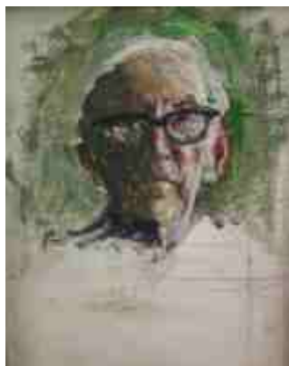
Автопортрет 1968 г.