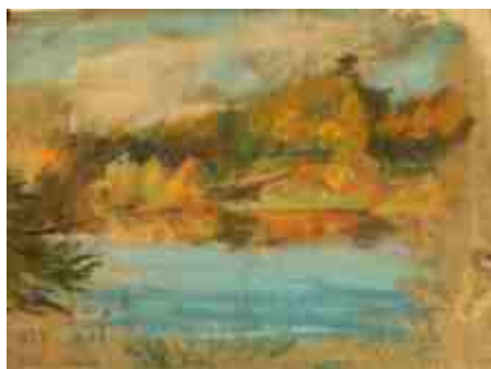
Парк Раади 1936 г.