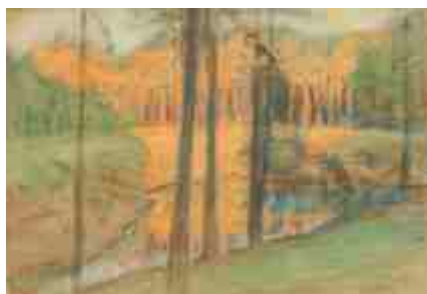
Осень. Пейзаж 1964 г.