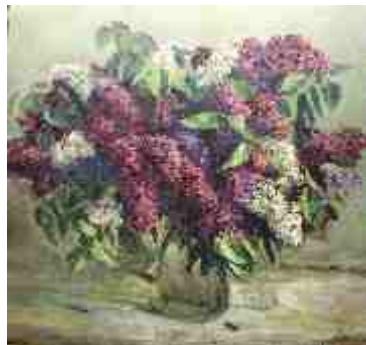
Сирень в стеклянной вазе 1962 г.