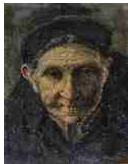
Портрет матери 1922 г.