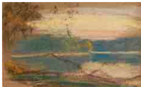
Озеро Пюхаярве вечером 1934 г.