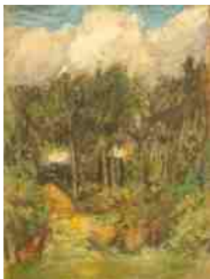
Лес Вазула 1933 г.