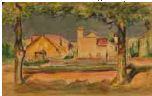
Городской пейзаж. Тарту. Улица Кеск 1959 г.