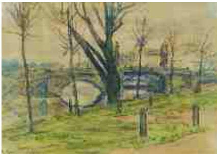
Вид Тарту. Каменный мост 1922 г.