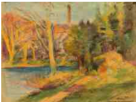
Парк Раади. Вид на винокурню 1934 г.